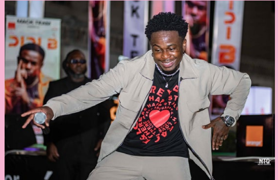
Le double concert de l'artiste Didi B • 28 et 29 janvier 2023