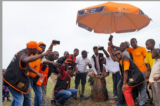
Les Festivités des mares en Haute Guinée